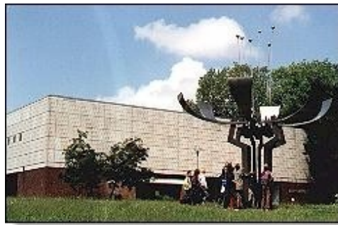
Kunsthalle in Rostock