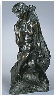
Skulptur von Camille Claudel