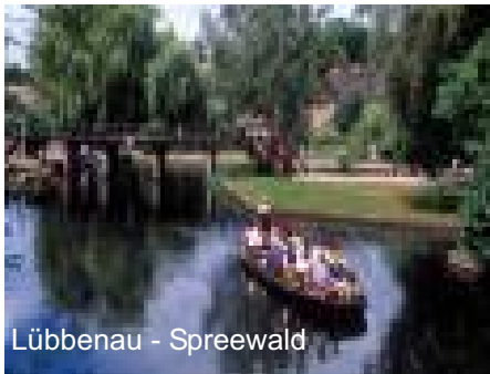
Lübbenau - Spreewald